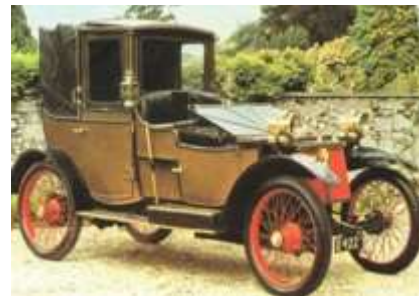
Автомобиль Ф. У. Ланчестера

Английским пионером автомобилестроения был Фредерик Уильям Ланчестер, который произвел свой первый автомобиль в 1895 году. Двумя современными усовершенствованиями этого автомобиля были пневматические шины и колеса со спицами. С этого момента развитие автомобиля пошло очень быстро.