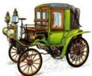
Автомобиль Готлиба Даймлера