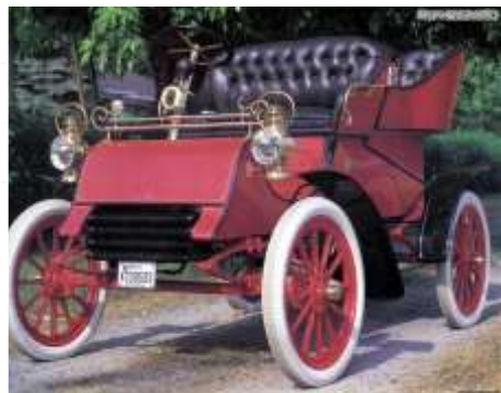
Автомобиль Г. Форда

Молодой американский изобретатель Генри Форд разработал модель автомобиля, который должен был продаваться по доступной цене. На заре автомобилестроения машины были привилегией богачей, и эксперимент Форда оказался удачным. Это привело к созданию крупнейшего в мире автомобильного завода Форда, который занимался изготовлением