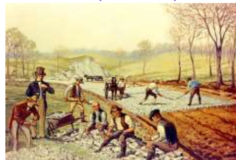
Строительство дороги Мак-Адамом

Для сохранения прочности дорогу нужно было время от времени посыпать песком. Такие дороги стали строить по всему миру и назвали