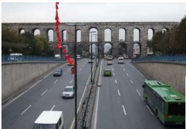
Дорога с акведуком

В 1987 году была построена экспериментальная четырехполосная бетонно-пластиковая дорога, обеспечивающая высокий уровень устойчивости при поворотах и хорошую управляемость транспортом при движении даже на мокром покрытии.