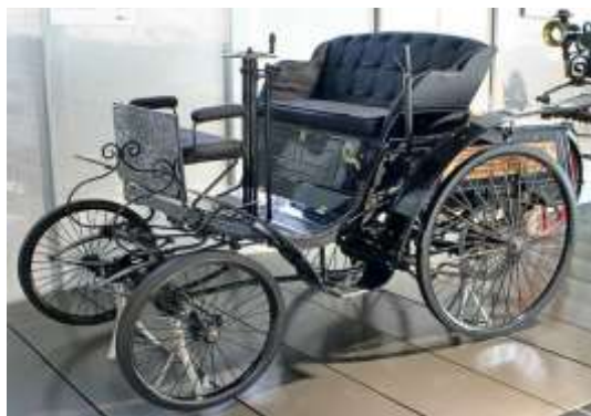
Автомобиль К. Бенца

Автомобиль Карла Бенца, появившийся в 1894 году, носил название «Вело», что в переводе с английского «быстрый».