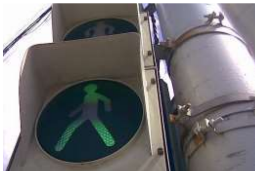
"Пляшущие человечки" проявились на светофорах всего несколько десятков лет назад