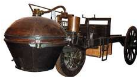
Машина Н-Ж. Кюньо

Четырехкратный двигатель был создан как модификация двигателя Отто в 1862 году Альфонсом Роша.