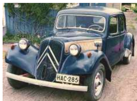
Автомобиль Ситроен Траксьон Аван