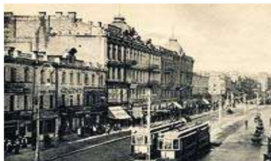
Электрический трамвай в Киеве