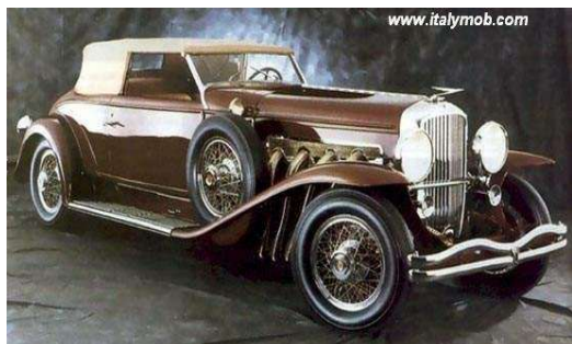
Автомобиль братьев Дюзенберг

В 1893 году карбюратор, модифицированный В. Мабайком, стал необходимой принадлежностью всех автомобилей.